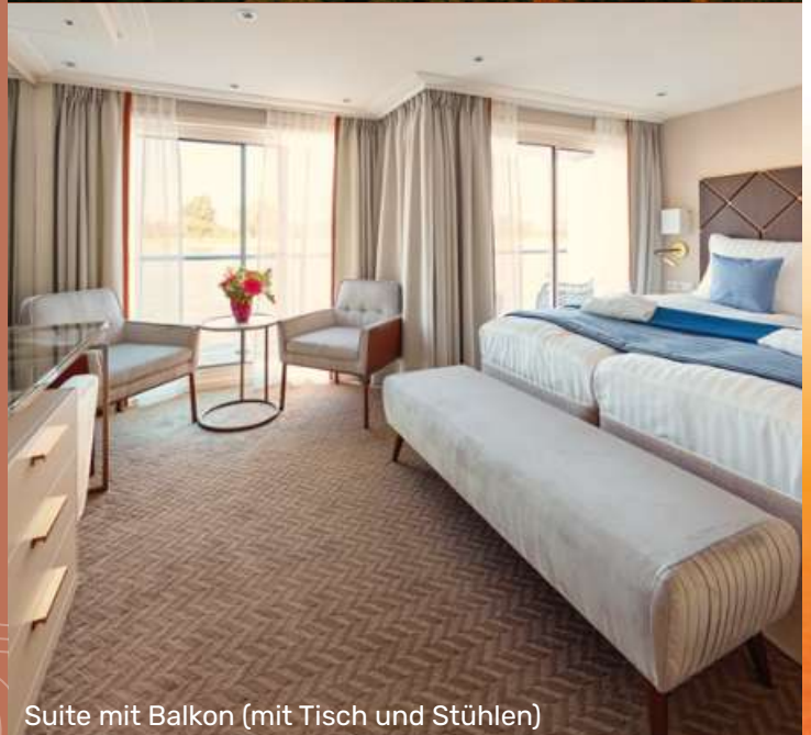
Suite mit Balkon (mit Tisch und Stühlen)