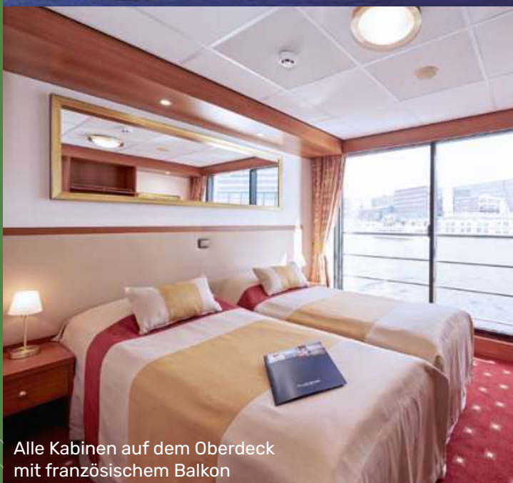
Alle Kabinen auf dem Oberdeck mit französischem Balkon