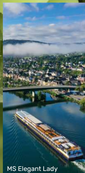
MS Elegant Lady