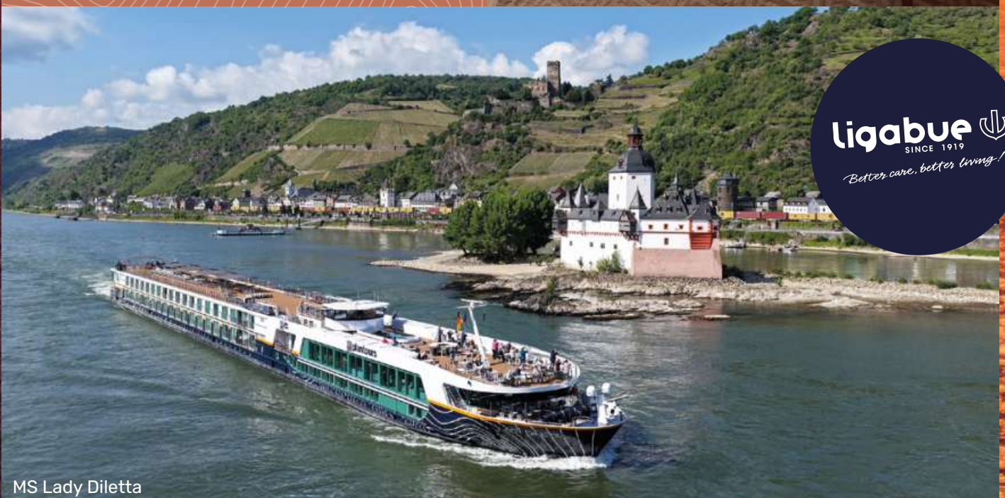
MS Lady Diletta