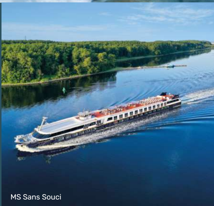
MS Sans Souci