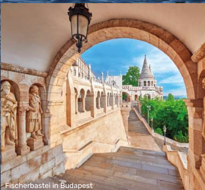
Fischerbastei in Budapest

Für eine komfortablere Hin- und Rückfahrt nach/von Passau bieten wir optional die bundesweite An-/ Abreise in modernen Fernreisebus- sen nach/von Passau inklusive Taxi-Service ab/bis Haustür an. Preis: 299 € p. Pers.