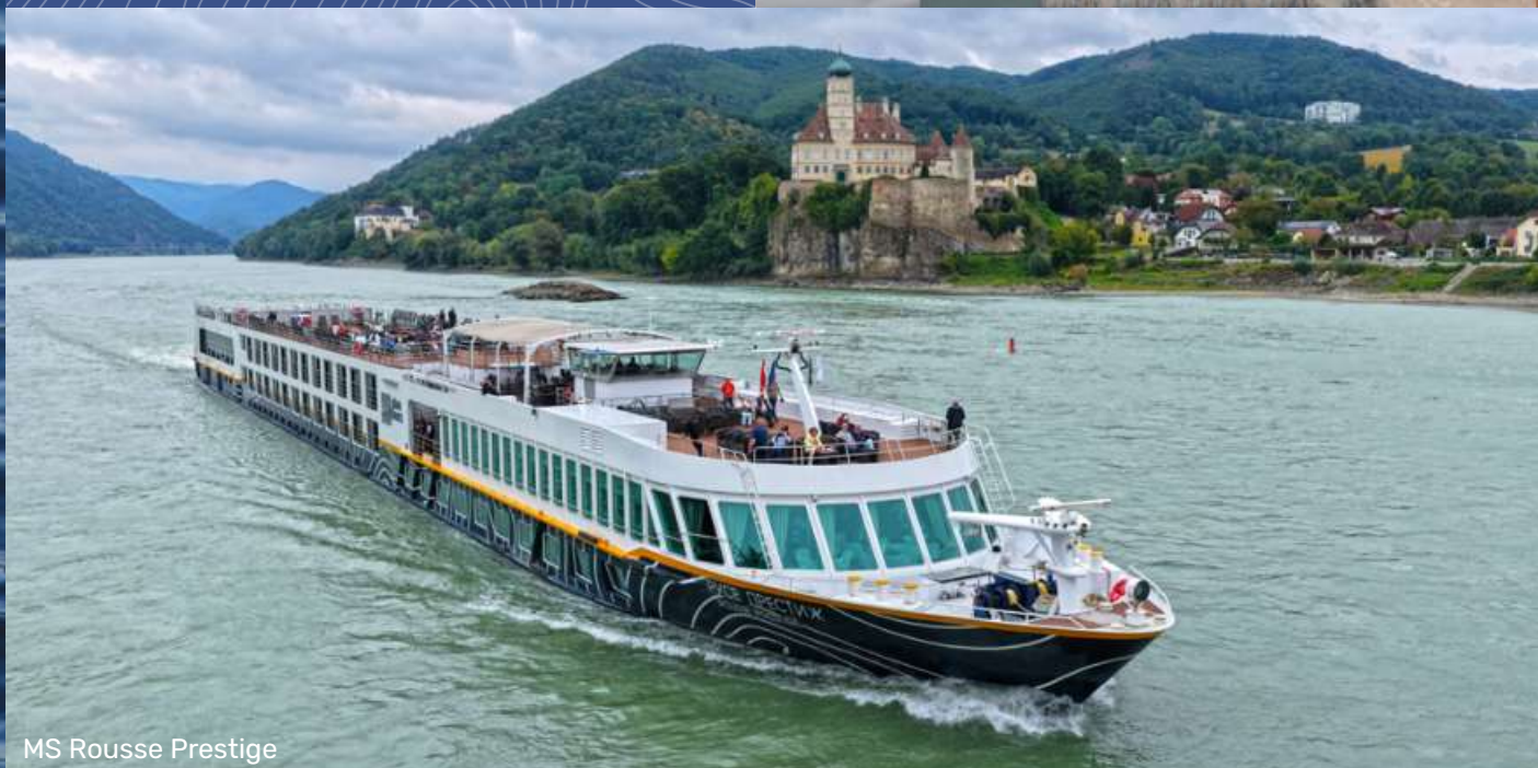
MS Rousse Prestige

Modernisierung aller Kabinen im Winter 2025/2026