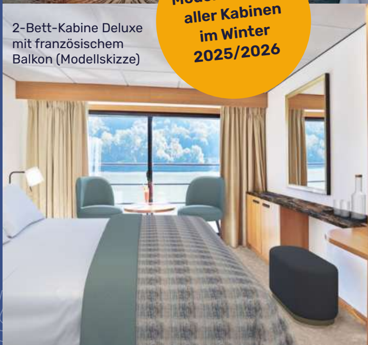
2-Bett-Kabine Deluxe mit französischem Balkon (Modellskizze)

Modernisierung aller Kabinen im Winter 2025/2026