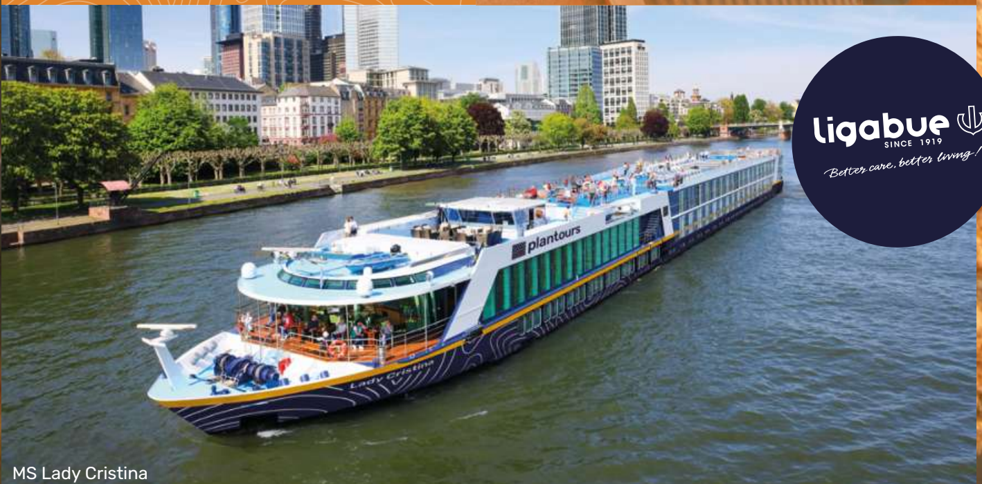
MS Lady Cristina

ligabue SINCE 1919 Better care, better living!