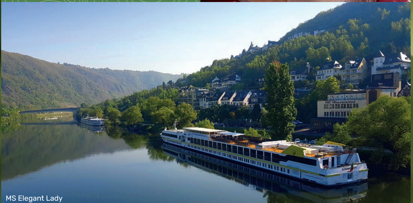
MS Elegant Lady