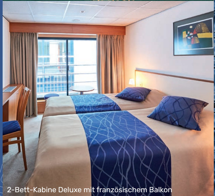
2-Bett-Kabine Deluxe mit französischem Balkon