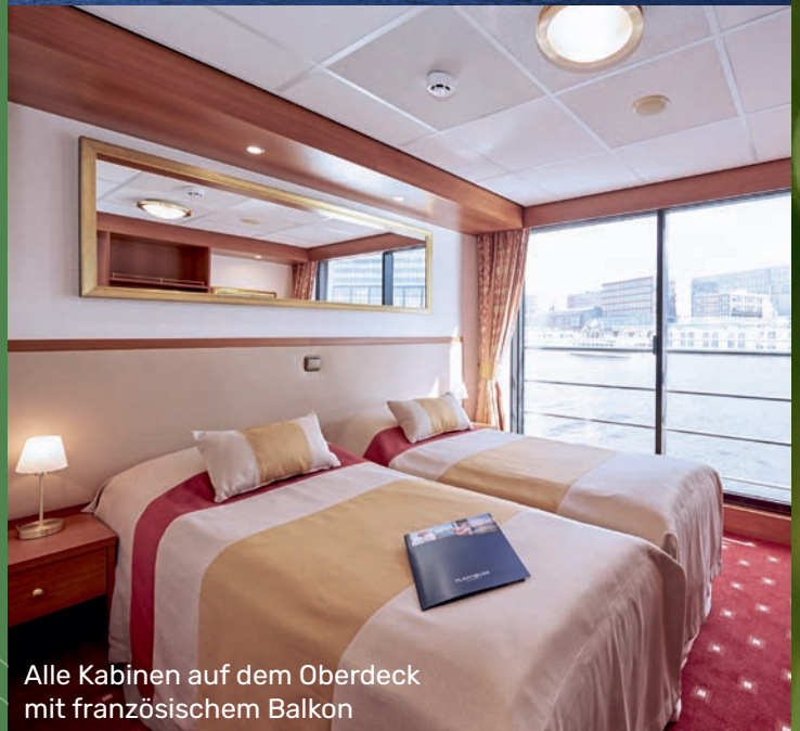
Alle Kabinen auf dem Oberdeck mit französischem Balkon