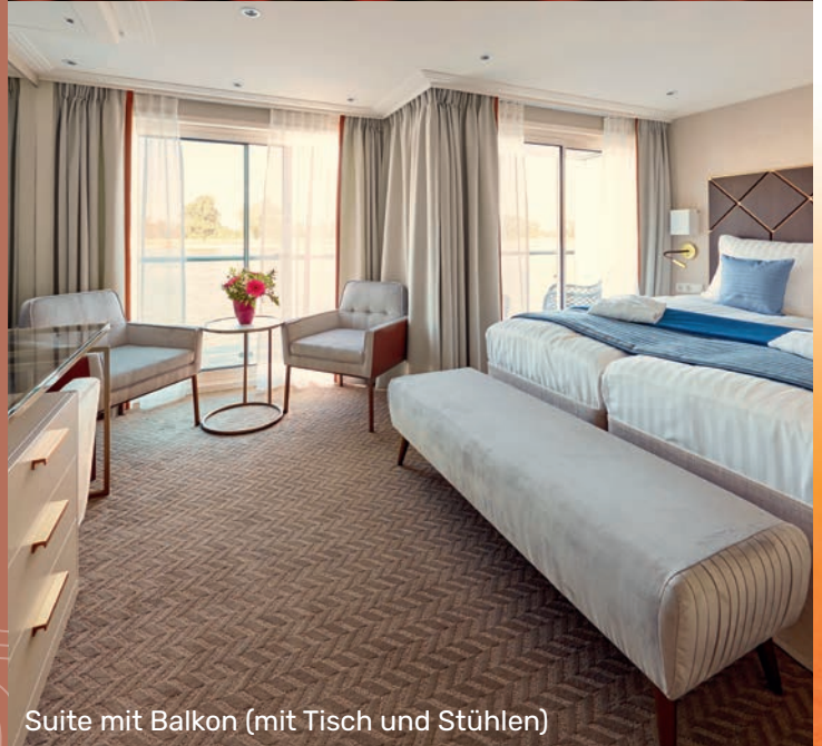
Suite mit Balkon (mit Tisch und Stühlen)