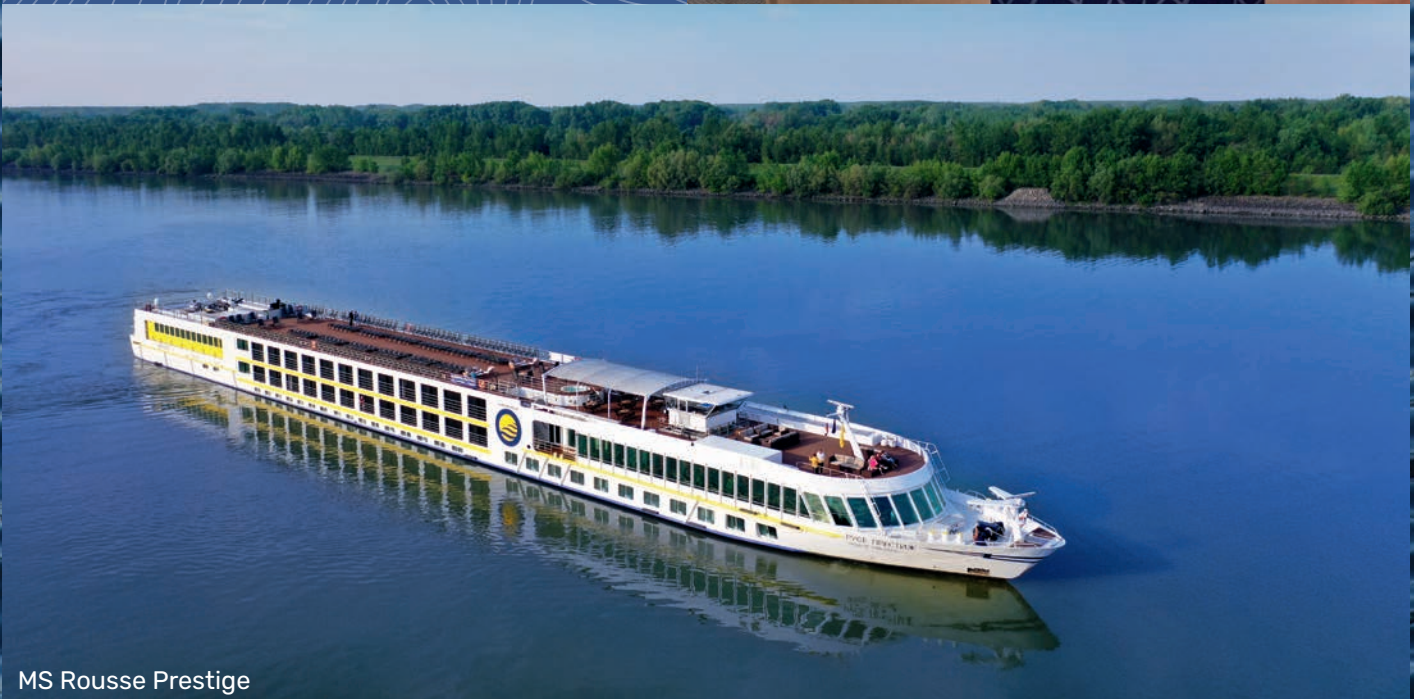
MS Rousse Prestige