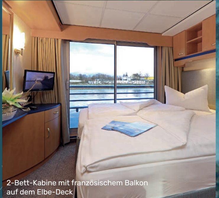
2-Bett-Kabine mit französischem Balkon auf dem Elbe-Deck