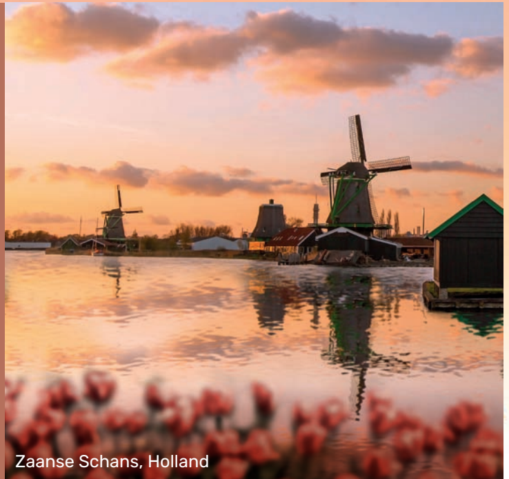
Zaanse Schans, Holland