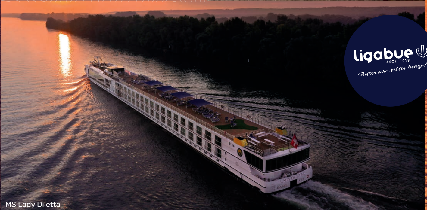
MS Lady Diletta