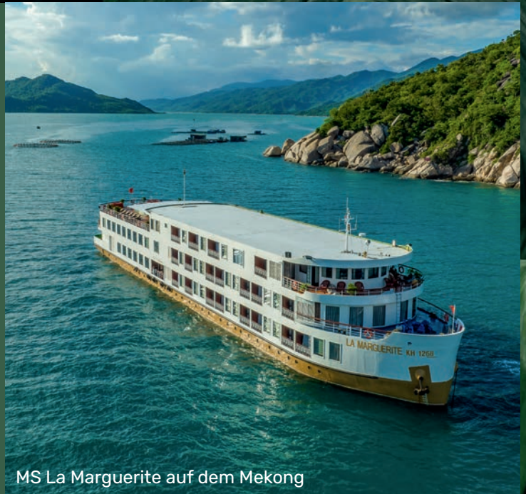
MS La Marguerite auf dem Mekong