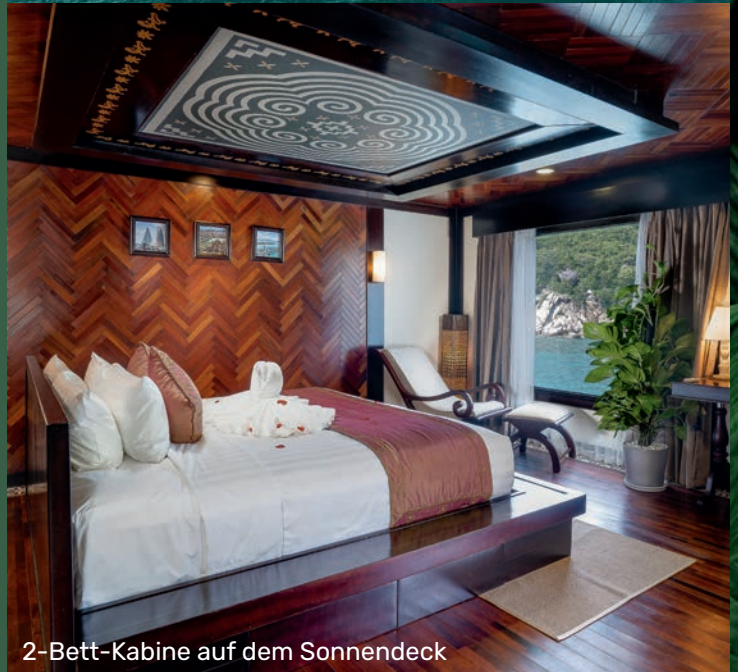
2-Bett-Kabine auf dem Sonnendeck