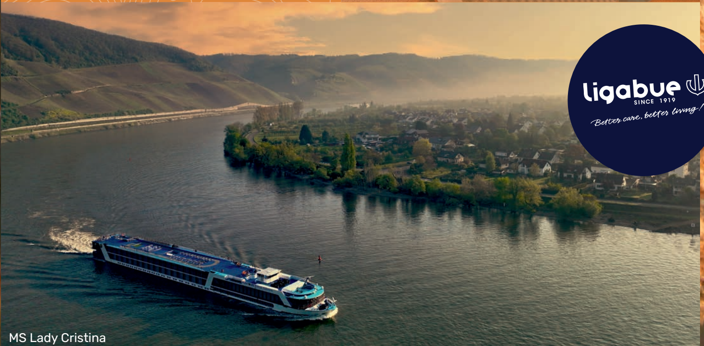
MS Lady Cristina