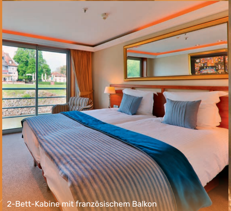
2-Bett-Kabine mit französischem Balkon